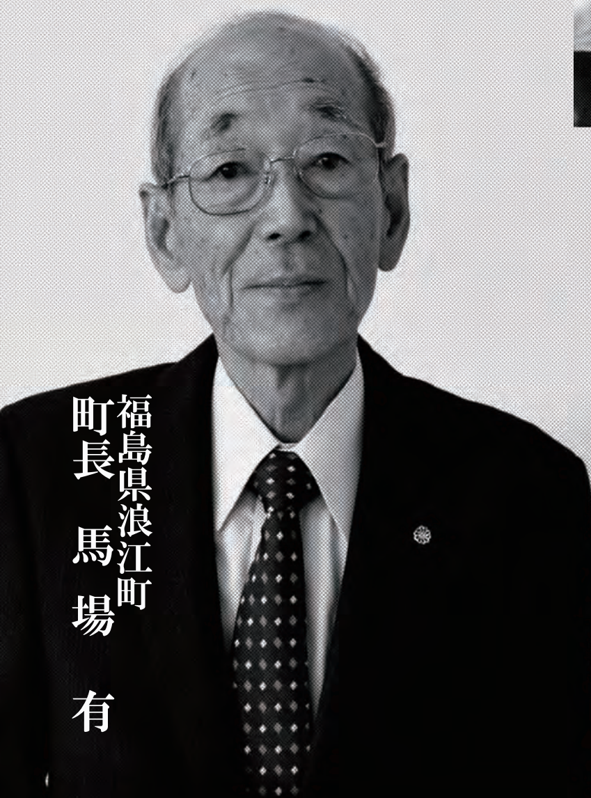
福島県浪江町 町長 馬場 有

災害が発生した時、 私達がとるべき行動は？ 私達に必要な情報は？ 行政や司法は、何をしてくれるの？ 自分と大切な人のいのちを守るために、 私達が今、備えておくべきことを 一緒に考えませんか？